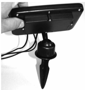
Zapíchnutí modulu do půdy

3. Nyní vyberte vhodné umístění pro montáž solárního modulu, v dosahu svítilen. Nasměrujte solární modul pokud možno na jižní stranu, aby na něj dopadalo přímé sluneční záření (aby nebyl tento solární modul ve stínu). Nasměrování na severní stranu může zabránit dostatečnému nabíjení do něho vložených akumulátorů. Prostřednictvím zemního kolíku lze modul zapíchnout do země nebo pomocí šroubovatelných držáků připevnit ke stěně nebo k podlaze či přimontovat ke sloupku (stožáru). Modul může být natočen proti slunečnímu světlu prostřednictvím kulového kloubu.