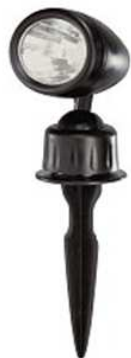
Zapíchnutí svítilny do půdy