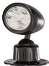
Montáž svítilny pomocí šroubků