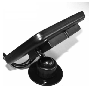
Montáž pomocí šroubků (vrutů)

4. Nyní připojte čtyři zástrčky svítilen a pohybového senzoru do zdířek umístěných na zadní straně solárního modulu.