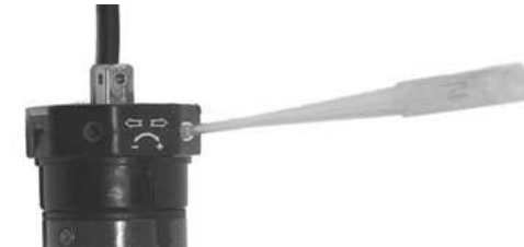
Šroubky a nástroj pro seřízení koncových poloh

Použijte příslušné 2 šrouby pro seřízení koncové polohy. Nastavení pak proveďte prostřednictvím dodávaného seřizovacího nástroje.