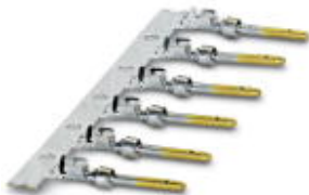
Lisovací kontakt, stočený, Samostatný kontakt, Průměr kontaktu: 1 mm, Oblast lisování: 0,22 mm 2 ...0,56 mm 2

Please be informed that the data shown in this PDF Document is generated from our Online Catalog. Please find the complete data in the user's documentation. Our General Terms of Use for Downloads are valid ( http://download.phoenixcontact.com )