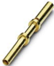
Lisovací kontakt, svinutý, Průměr kontaktu: 0,6 mm, Oblast lisování: 0,14 mm 2 ...0,34 mm 2

Please be informed that the data shown in this PDF Document is generated from our Online Catalog. Please find the complete data in the user's documentation. Our General Terms of Use for Downloads are valid ( http://download.phoenixcontact.com )