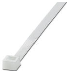
Spona kabelů, standardní verze, pro rychlé a bezpečné spojování

Upozorňujeme, že zde uvedené údaje pocházejí z online katalogu. Úplné informace a údaje naleznete v uživatelské dokumentaci. Platí všeobecné podmínky použití pro stahování z internetu. ( http://phoenixcontact.de/download )