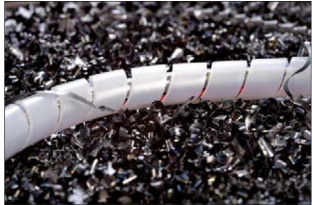
SBPA spiralslange af polyamid giver fremragende beskyttelse mod slid.