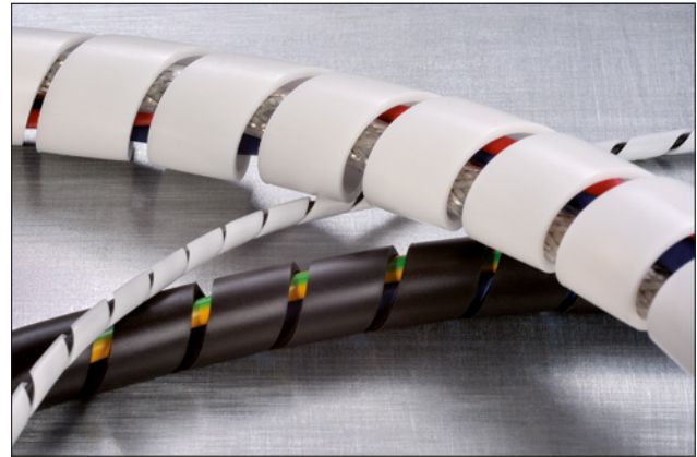
SBPEFR spiralslange fås i forskellige dimensioner samt farverne sort og hvid.