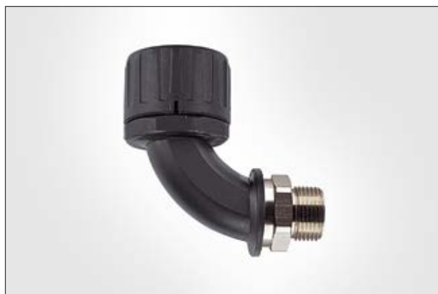
HelaGuard HG-90M fitting 90° med svivel med udv. gevind, IP66.