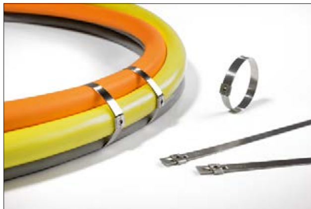
Rustfri Stålkabelbindere MST Serien.

For godkendelser se tillægsinformation bagerst i kataloget.