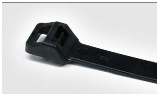
Genoplukkelig binder REL 250 serien.