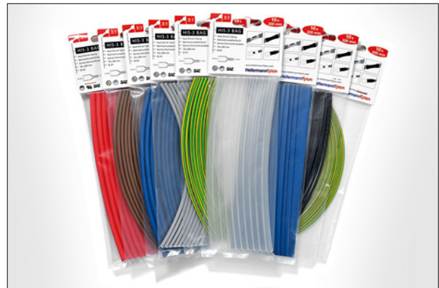
HIS-3 BAG kan leveres i syv farver og fire størrelser.