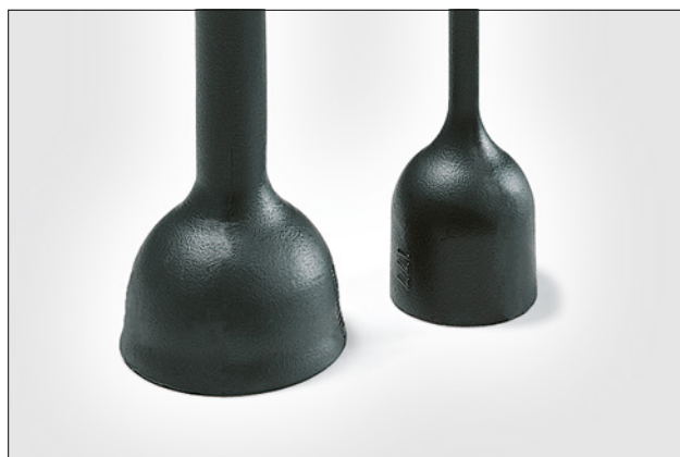
Formgods 177-1-G før krymp og krympet.