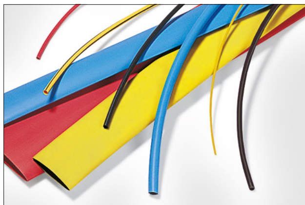
TF21 leveres i en række forskellige farver og størrelser.

Afkortede længder tilgængelig ved forespørgsel. Venligst kontakt os!