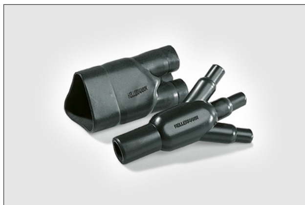
Formgods 300-serien før og efter krympning.