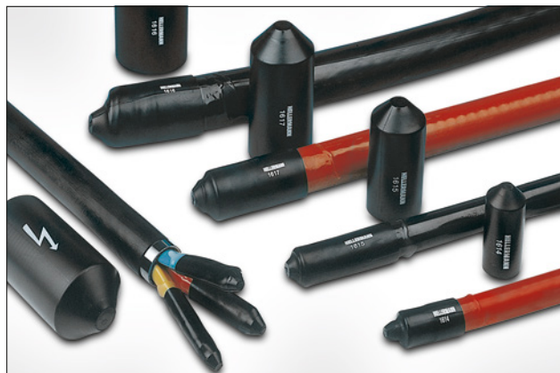
Den rigtige endehætte for enhver kabel diameter og kabeltype.