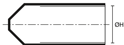
a. Formgods før krymp (som leveret)