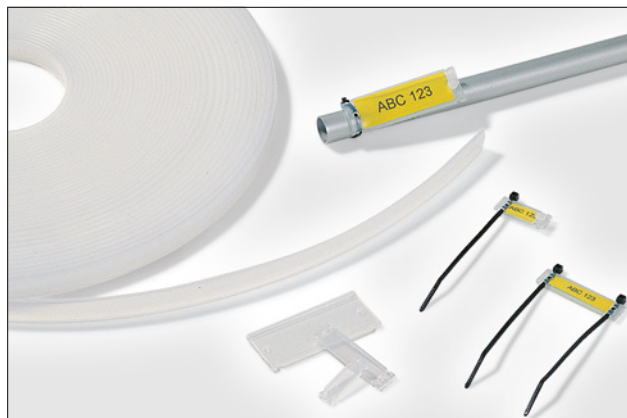
Helafix HC/HCR giver en multifunktional mærkning.