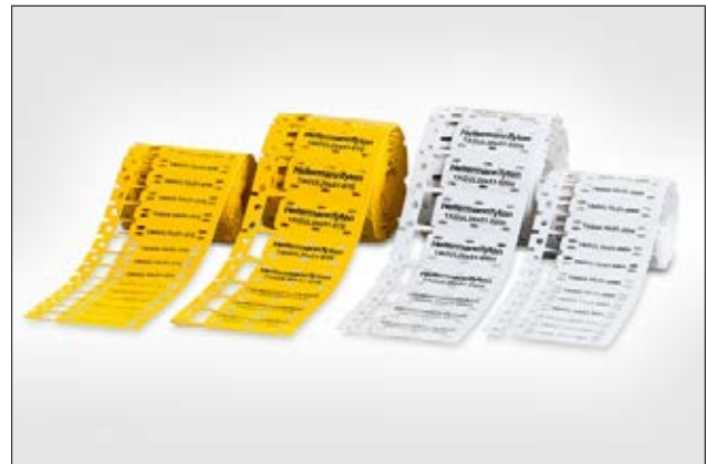
TAGUL MIL godkendt TipTag i stigeform.