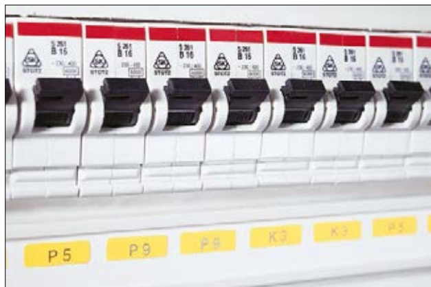
Mærkning i tavler og grupperkabe.