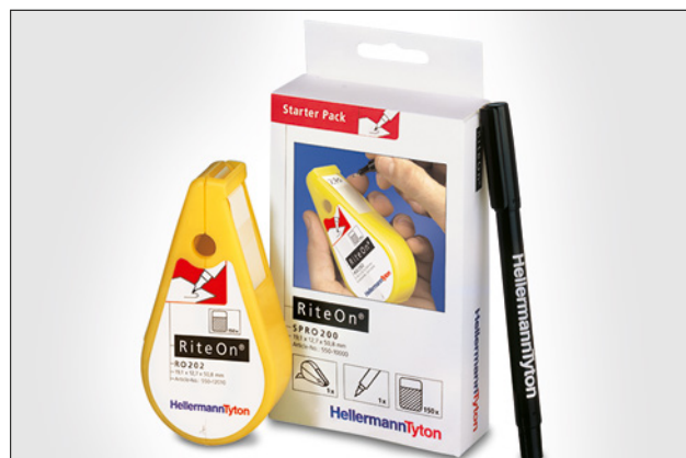
Er hurtig og let og kan anvendes overalt