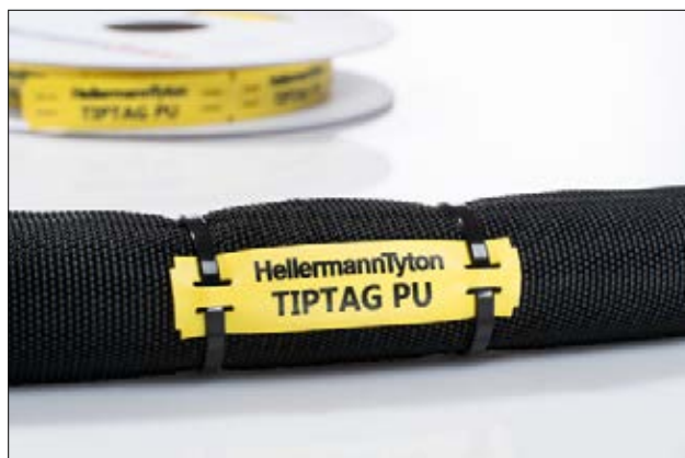
Printet har karakter som en tatovering.