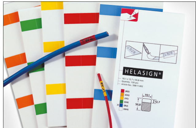
Altid ved hånden: Labels in en praktisk lommebog.