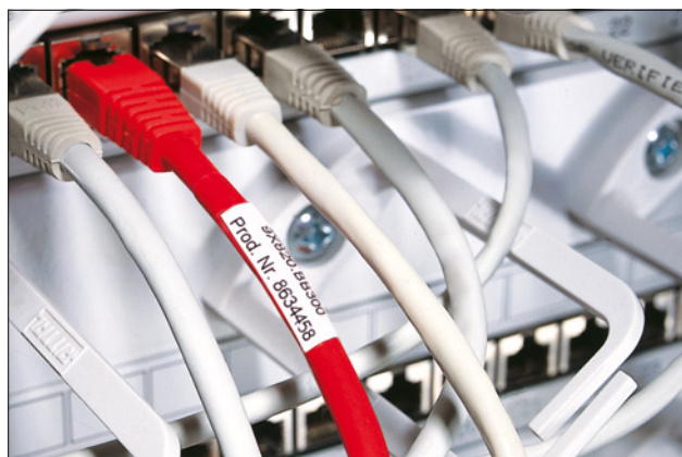
Selvaminerende labels giver en optimal beskyttelse mod fugt, smuds og mekanisk slidtage.