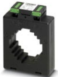
Aufsteckstromwandler, Primärstrom 1000 A AC; Sekundärstrom 5 A AC; Genauigkeitsklasse 1; Bemessungsleistung 15 VA

Bitte beachten Sie, dass die hier angegebenen Daten dem Online-Katalog entnommen sind. Die vollständigen Informationen und Daten entnehmen Sie bitte der Anwenderdokumentation. Es gelten die Allgemeinen Nutzungsbedingungen für Internet-Downloads. ( http://download.phoenixcontact.de )