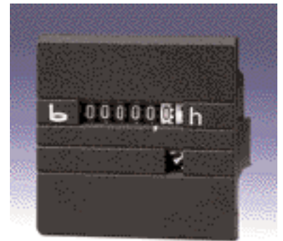
Typ 632, 632.1, 634, 634.1, 630, 630.1, 638, 638.1