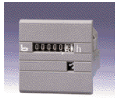
Typ 631.2, 631.3, 633.2, 633.3, 629.2, 629.3, 637.2, 637.3