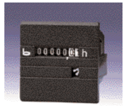
Typ 632.2, 632.3, 634.2, 634.3, 630.2, 630.3, 638.2, 638.3