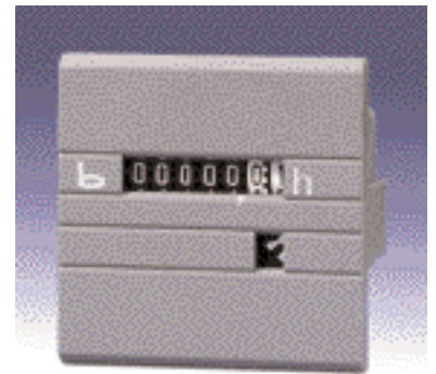
Typ 631, 631.1, 633, 633.1, 629, 629.1, 637, 637.1