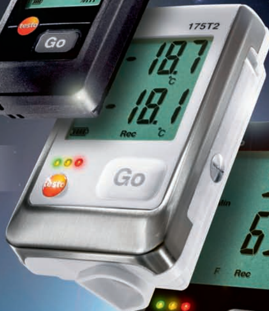
Logger-Familie testo 176