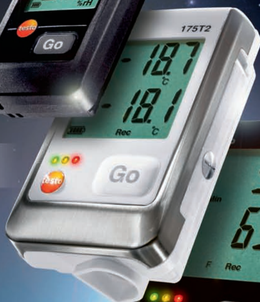
Logger-Familie testo 176