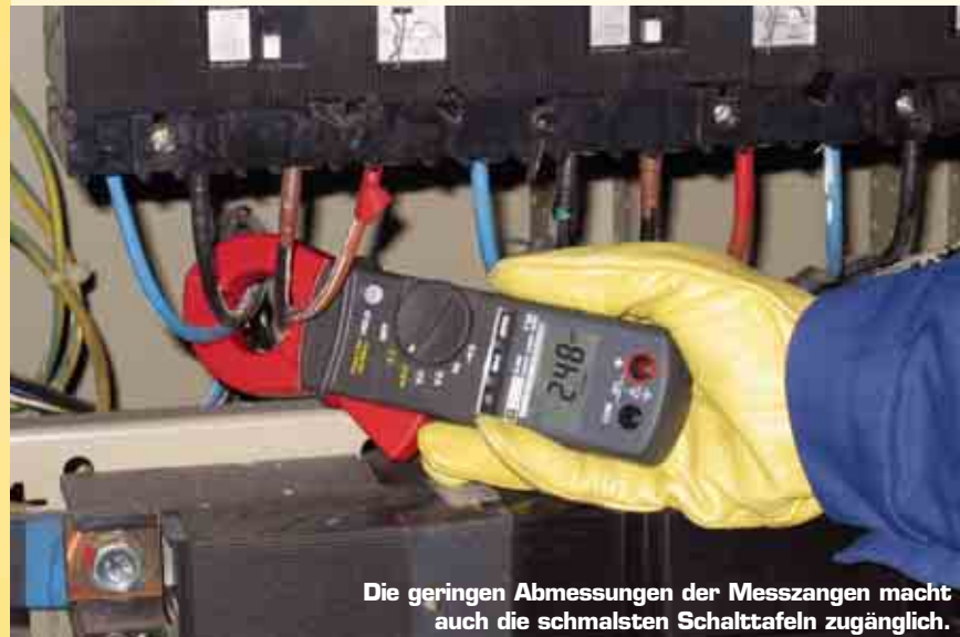
Die geringen Abmessungen der Messzangen macht auch die schmalsten Schalttafeln zugänglich.

Für Fachleute der Prüfstellen, der industriellen und gewerblichen Wartung, die mit diesen Schwierigkeiten konfrontiert werden, sind die Messzangen F62/F65 die idealen Werkzeuge. Darüber hinaus gewährleisten diese Geräte auch sämtliche Funktionen einer Vielfachmesszange.