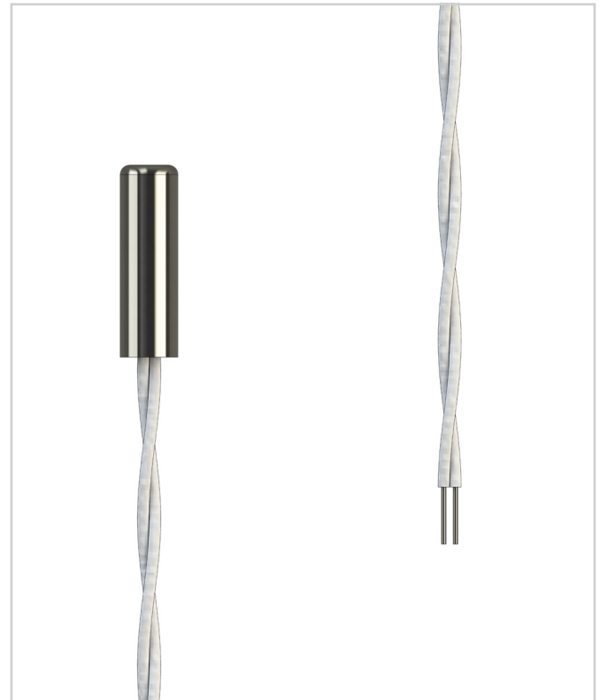
Das Bild dient nur zu Illustrationszwecken

Schweißen, Crimpen, Hartlöten, Weichlöten, Anklemmen