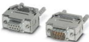
Bus-Steckverbindersatz, Lötanschluss, Stecker/Buchse

Bitte beachten Sie, dass die hier angegebenen Daten dem Online-Katalog entnommen sind. Die vollständigen Informationen und Daten entnehmen Sie bitte der Anwenderdokumentation. Es gelten die Allgemeinen Nutzungsbedingungen für Internet-Downloads. ( http://download.phoenixcontact.de )