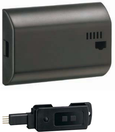
Zubehör: Datenschlüssel Save 'n carry pro