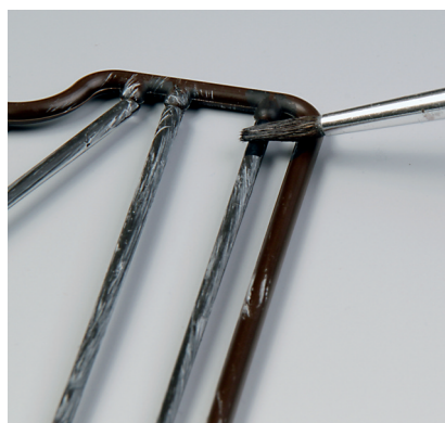
Die unteren Mastenden bekommen einen schwarzen „Teeranstrich“