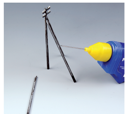
Jetzt werden, so weit erforderlich, noch individuelle Abstützungen angebracht