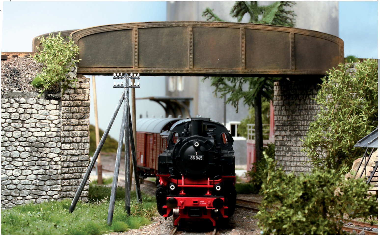
Einst an jeder Strecke zu finden: Telegrafenmasten. Im Bereich von Gleisbögen müssen die Masten mit einer zusätzlichen Abstützung versehen werden