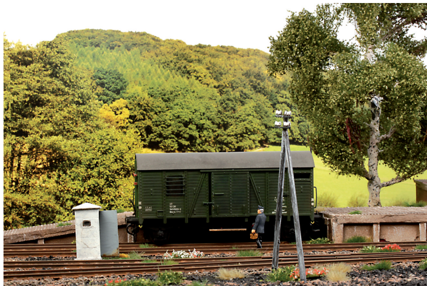
Die Telegrafenmasten gehörten einst zum alltäglichen Bild neben den Gleisen und sollten daher auch auf keiner Anlage fehlen. Sogar heute findet man sie noch an vielen weniger bedeutenden Strecken

die Streckenlängen auf der Anlage sind gegenüber denen beim Vorbild ja auch stark verkürzt. Da auf die Nachbildung der Fernmeldedrähte bei diesen Masten verzichtet werden sollte (dafür fehlt ihnen die Stabilität), müssen sie nur noch leicht versenkt neben den Gleisen eingeklebt werden.