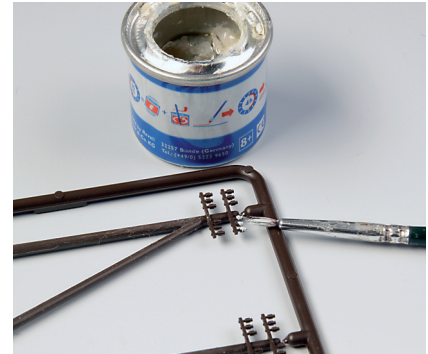
Anschließend werden die Isolatoren mit etwas weißer Farbe abgesetzt