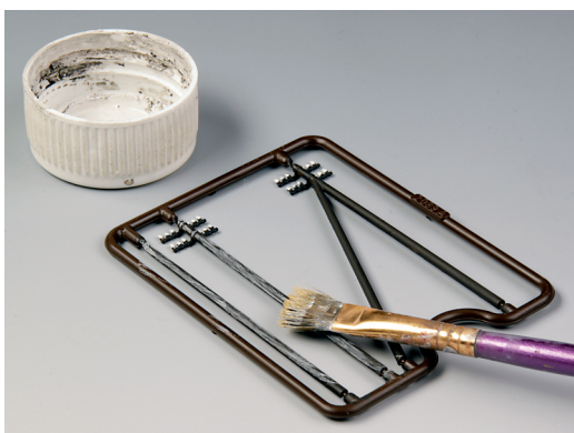
Die Masten erhalten zunächst etwas übertrieben wirkende Verwitterungsspuren