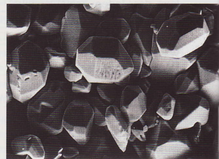
Nach 2 Jahren Laufzeit stark geschädigte Batterieplatte. Auffallend die starke Kristallbildung (sog. Sulfatierung), wodurch die Batterie kaum noch in der Lage ist, Ladung aufzunehmen.

Reifenluftdruck und Motoröl ständig kontrolliert werden, sondern eben auch die Batterie.“ Was man dazu benötigt, ist lediglich ein Zigarettenanzünder sowie den Spannungsanzeiger APM1. Er kontrolliert neben der aktuell vorhandenen Batteriespannung auch den Ladestrom des Generators. Ei-