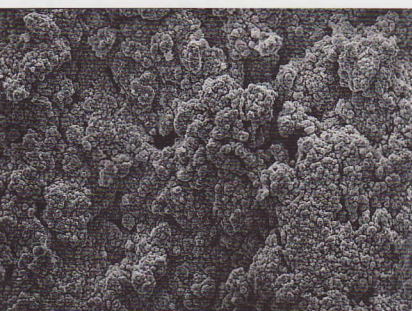
Eine neue ungenutzte Batterieplatte, wie sie in einer fabrikneuen Batterie aussehen sollte.

ne Kontrollleuchte warnt vor einem defekten Generator bei laufendem Motor, eine weitere Lampe informiert bei abgestelltem Motor über zu geringe Batteriespannung. „Ein solches, in der Bedienung wirklich einfaches Gerät, liefert im Handumdrehen alle relevanten Batterie- und Generatordata-