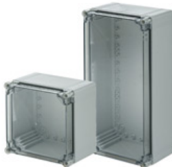
Außenbefestigungslaschen Satz mit je 4 Stück