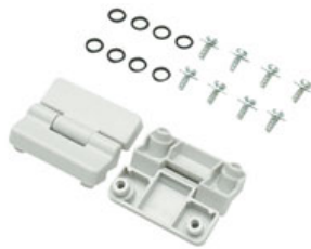
Scharniere Satz mit je 2 Stück