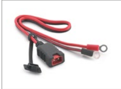
Im Lieferumfang enthalten