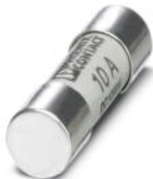
Sicherung, 10,3 mm x 38 mm, bis 1000 V DC, gPV Charakteristik

Bitte beachten Sie, dass die hier angegebenen Daten dem Online-Katalog entnommen sind. Die vollständigen Informationen und Daten entnehmen Sie bitte der Anwenderdokumentation. Es gelten die Allgemeinen Nutzungsbedingungen für Internet-Downloads. ( http://download.phoenixcontact.de )