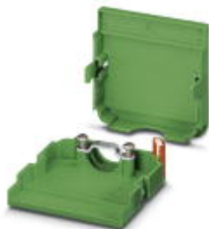
Kabelgehäuse, Rastermaß: 3,81 mm, Polzahl: 15, Maß a: 59,54 mm, Farbe: grün

Bitte beachten Sie, dass die hier angegebenen Daten dem Online-Katalog entnommen sind. Die vollständigen Informationen und Daten entnehmen Sie bitte der Anwenderdokumentation. Es gelten die Allgemeinen Nutzungsbedingungen für Internet-Downloads. ( http://download.phoenixcontact.de )