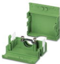
Kabelgehäuse, Rastermaß: 0 mm, Polzahl: 7, Maß a: 35 mm, Farbe: grün

Bitte beachten Sie, dass die hier angegebenen Daten dem Online-Katalog entnommen sind. Die vollständigen Informationen und Daten entnehmen Sie bitte der Anwenderdokumentation. Es gelten die Allgemeinen Nutzungsbedingungen für Internet-Downloads. ( http://download.phoenixcontact.de )