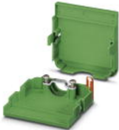
Kabelgehäuse, Rastermaß: 3,81 mm, Polzahl: 6, Maß a: 25,25 mm, Farbe: grün

Bitte beachten Sie, dass die hier angegebenen Daten dem Online-Katalog entnommen sind. Die vollständigen Informationen und Daten entnehmen Sie bitte der Anwenderdokumentation. Es gelten die Allgemeinen Nutzungsbedingungen für Internet-Downloads. ( http://download.phoenixcontact.de )