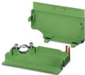
Kabelgehäuse, Rastermaß: 0 mm, Polzahl: 13, Maß a: 65 mm, Farbe: grün

Bitte beachten Sie, dass die hier angegebenen Daten dem Online-Katalog entnommen sind. Die vollständigen Informationen und Daten entnehmen Sie bitte der Anwenderdokumentation. Es gelten die Allgemeinen Nutzungsbedingungen für Internet-Downloads. ( http://download.phoenixcontact.de )