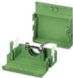
Kabelgehäuse, Rastermaß: 0 mm, Polzahl: 4, Maß a: 20 mm, Farbe: grün

Bitte beachten Sie, dass die hier angegebenen Daten dem Online-Katalog entnommen sind. Die vollständigen Informationen und Daten entnehmen Sie bitte der Anwenderdokumentation. Es gelten die Allgemeinen Nutzungsbedingungen für Internet-Downloads. ( http://download.phoenixcontact.de )