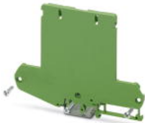
Seitenelement mit Fuß, hohe Ausführung, links, für 73 mm breite U-Profil-Abdeckung.

Bitte beachten Sie, dass die hier angegebenen Daten dem Online-Katalog entnommen sind. Die vollständigen Informationen und Daten entnehmen Sie bitte der Anwenderdokumentation. Es gelten die Allgemeinen Nutzungsbedingungen für Internet-Downloads. ( http://download.phoenixcontact.de )