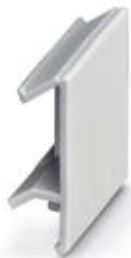
Blindstopfen, für unbestückte Klemmstellen, Farbe: lichtgrau

Bitte beachten Sie, dass die hier angegebenen Daten dem Online-Katalog entnommen sind. Die vollständigen Informationen und Daten entnehmen Sie bitte der Anwenderdokumentation. Es gelten die Allgemeinen Nutzungsbedingungen für Internet-Downloads. ( http://download.phoenixcontact.de )