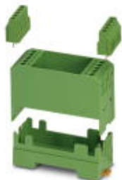
Elektronik-Gehäuse-Set, bestehend aus Elektronik-Gehäuse und Print-Klemmenblöcken, Raster 5

Bitte beachten Sie, dass die hier angegebenen Daten dem Online-Katalog entnommen sind. Die vollständigen Informationen und Daten entnehmen Sie bitte der Anwenderdokumentation. Es gelten die Allgemeinen Nutzungsbedingungen für Internet-Downloads. ( http://download.phoenixcontact.de )