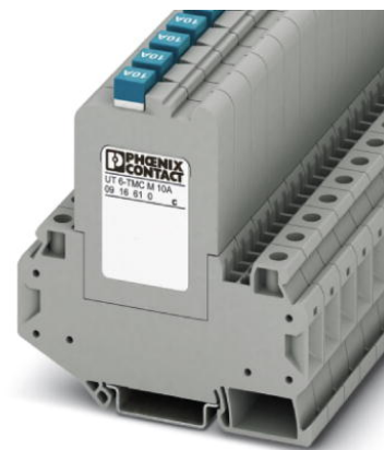
Bild zeigt die 10 Ampère-Variante

http://eshop.phoenixcontact.de/phoenix/treeViewClick.do?UID=0916612