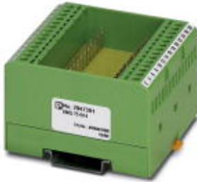
Bestückungs-Modul, bestehend aus Gehäuse, Anschlussklemmen MKDS 3 und Leiterplatte

Bitte beachten Sie, dass die hier angegebenen Daten dem Online-Katalog entnommen sind. Die vollständigen Informationen und Daten entnehmen Sie bitte der Anwenderdokumentation. Es gelten die Allgemeinen Nutzungsbedingungen für Internet-Downloads. ( http://download.phoenixcontact.de )