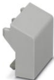
Blindstopfen, für unbestückte Klemmstellen

Bitte beachten Sie, dass die hier angegebenen Daten dem Online-Katalog entnommen sind. Die vollständigen Informationen und Daten entnehmen Sie bitte der Anwenderdokumentation. Es gelten die Allgemeinen Nutzungsbedingungen für Internet-Downloads. ( http://download.phoenixcontact.de )