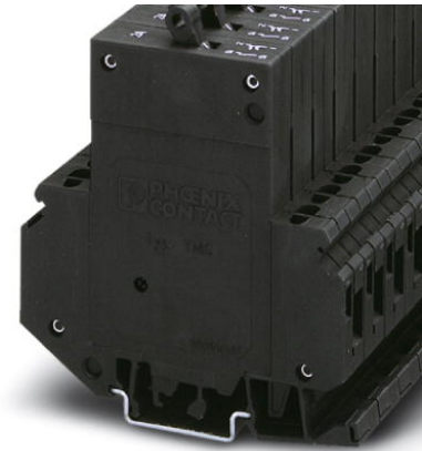
Abbildung zeigt die Variante TMC 1 F1 100 1A

http://eshop.phoenixcontact.de/phoenix/treeViewClick.do?UID=0914811