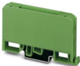
Elektronik-Gehäuse, mit Universalfuß, ohne Schraubanschlussklemmen und Haube

Bitte beachten Sie, dass die hier angegebenen Daten dem Online-Katalog entnommen sind. Die vollständigen Informationen und Daten entnehmen Sie bitte der Anwenderdokumentation. Es gelten die Allgemeinen Nutzungsbedingungen für Internet-Downloads. ( http://download.phoenixcontact.de )