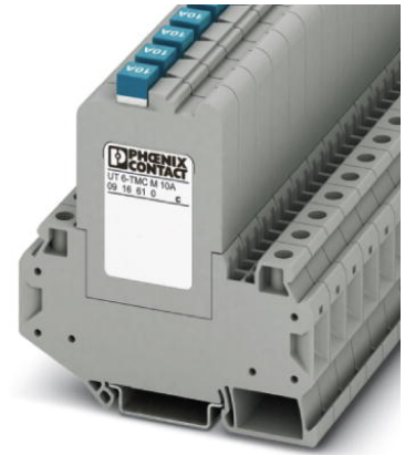
Bild zeigt die 10 Ampère-Variante

http://eshop.phoenixcontact.de/phoenix/treeViewClick.do?UID=0916606